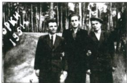
Ремесленное училище №10. 1951 г. Поход в Горки. Слева направо: воспитатель Яков Андреевич, комсорг Игорь Григорьевич, физрук Алексей Прокопьевич.