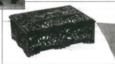
Ажурная шкатулка из чугуна. Подарок Гагаринным от друзей-уральцев. Город Саратов, 6 января 1965 г.

воде по заказу Каслинского училища очень старательно и долго изготавливали часы для первого космонавта. Потом я их доставил в Касли. В мастерских училища они были вмонтированы в чугунный подчасник «В космос». И только после этого я и моя жена Рая отправились в Москву.