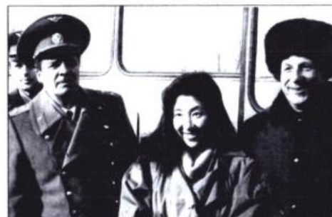
В день рождения Ю.А. Гагарина. Слева направо: летчик-космонавт Вячеслав Дмитриевич Зудов, журналистка-дублер космонавта Японии Кикичи Риою, Валентин Алексеевич Гагарин. Город Гагарин. 9 марта 1990 г.