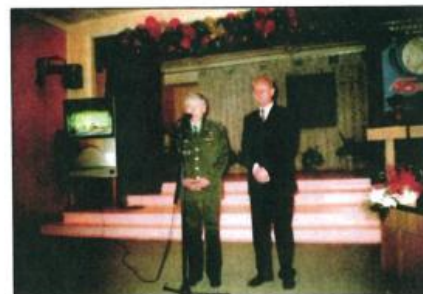
Герой России, космонавт, полковник Юрий Георгиевич Шаргин поздравляет учащихся и работников Саратовского колледжа с 45-летием полета Юрия Гагарина. Город Саратов. 11 апреля 2006 г.