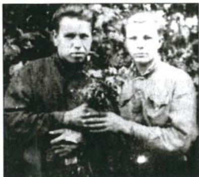
Ремесленное училище №10. Поход в Горки. Справа налево: Юрий Гагарин, Тимофей Чугунов. Город Люберцы. 1951 г.