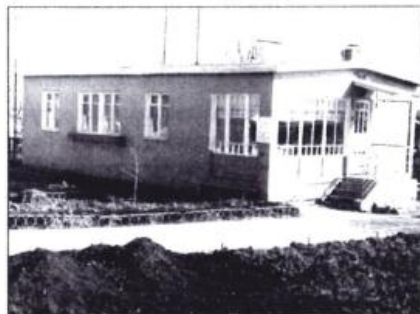
После полета Ю.А. Гагарина его родители жили в этом доме. Юрий Гагарин часто приезжал к родителям. Город Гагарин, 1981 г.

отметил эту особенность: наши жизненные тропы, где бы ни находились, все время переплетались.