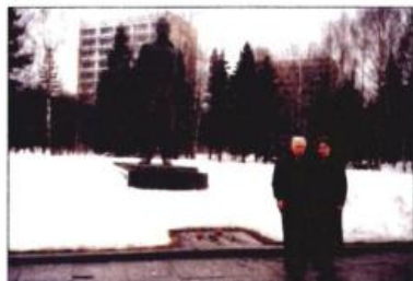
Звездный городок. У памятника Юрию Алексеевичу Гагарину. Март 2001 г.