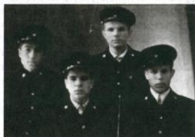
Индустриальный техникум. Слева направо: Иван Перегудов, Александр Петушков, Юрий Гагарин, Тимофей Чугунов. Город Саратов. Сентябрь 1951 г.