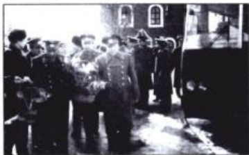
9 марта в день рождения Юрия Алексеевича Гагарина приезжают космонавты и другие гости из Москвы. Город Гагарин. Март 1990 г.