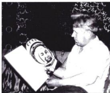
Минуты воспоминаний о нашей юности.