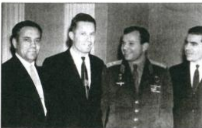
20-летие индустриального техникума. Слева направо: Петр Федоров, Тимофей Чугунов, Юрий Гагарин, Александр Петушков. Город Саратов, 6 января 1965 г.