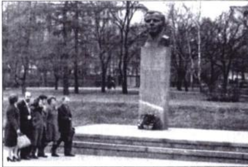
Аллея космонавтов. Город Москва. Апрель 1981 г.