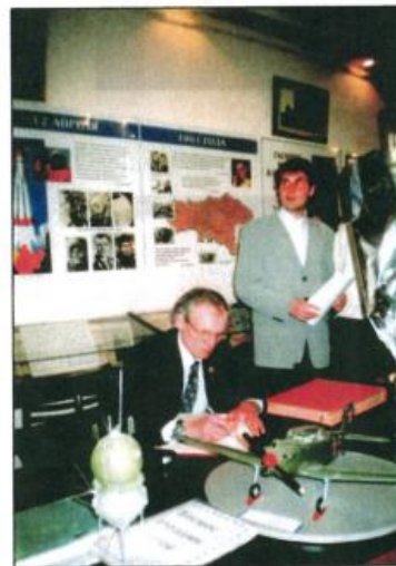
Герой России, космонавт Сергей Васильевич Авдеев делает запись в Книге почетных гостей Саратовского музея Ю.А. Гагарина. Город Саратов. 11 апреля 2006 г.