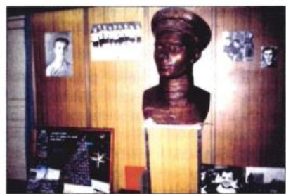
Музей Ю.А. Гагарина в лицее №10. Бюст Юрия Гагарина, автор - А.С. Гизлев, г. Касли.