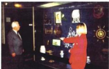
Музей Звездного городка. Какое счастье побывать в музее и послушать интересный рассказ экскурсовода об экспонатах музея и его создателях. Март 2001 г.

бок по содержанию и простые по форме изложения, были очень полезными для всех. Мы полнее усваивали учебный материал. Во время перерывов между уроками Юрий отдыхал, исполнял шуточные песни, рассказывал о рыбалке в период летних каникул. Вокруг него толпа. Его любили и уважали за душевную доброту к людям.