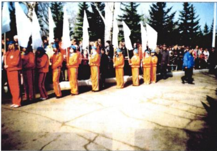
На месте приземления Юрия Алексеевича Гагарина в честь 45-летия его полета. Село Смеловка Энгельсского района Саратовской области. 12 апреля 2006 г.