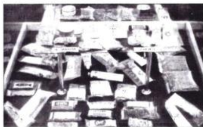
Музей Ю.А. Гагарина в училище №10. Набор продуктов для космонавтов. Город Люберцы.