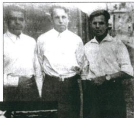
Ремесленное училище №10. Слева направо: Александр Петушков, Тимофей Чугунов, Юрий Гагарин. Город Люберцы. 1949 г.