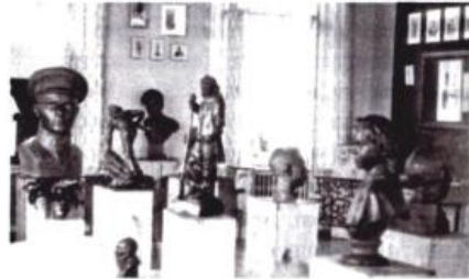
В мастерской скульптора А.С. Гилева. Бюст и фигура Юрия Гагарина. Город Касли. 1971 г.