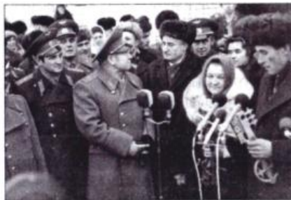
Строители города Гагарин вручают матери первого космонавта символический ключ от нового дома. Город Гагарин. 20 декабря 1983 г.

часто обращались к нам за помощью, и мы охотно помогали товарищам разобраться в неясных вопросах. Особенно неважно было у многих студентов с математикой... А мы все трое любили математику. ...С каждым днем у студентов все больше и больше проявлялся вкус к занятиям. Двойки постепенно исчезали, их заменяли тройки, а потом и их почти не стало».