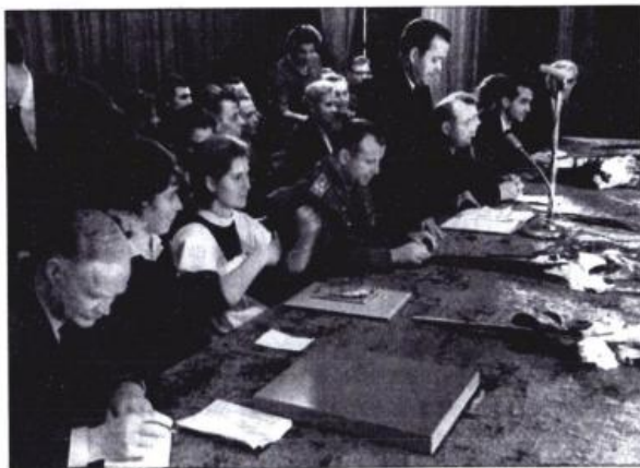
Президиум торжественного собрания, посвященного 40-летию профтехучилища №10. Слева направо: председатель Госкомитета по профессиональному образованию РСФСР Кирпичников, учащиеся, Ю.А. Гагарин, В.М. Быков. Город Люберцы. 30 сентября 1965 г.