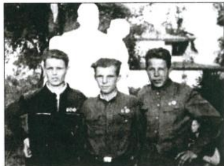
Ремесленное училище №10. Справа налево: Тимофей Чугунов, Юрий Гагарин, ... На стадионе. Город Люберцы. 1950 г.