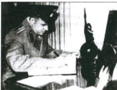
Павильон «Трудовые резервы» ВДНХ. Юрий Гагарин сделал запись в книге Почетных гостей. Ему вручена статуэтка «В космос», автор А.С. Гилев. Город Москва. Сентябрь 1961 г.