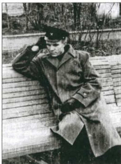
Юрий Гагарин. В городском саду «Липки». Город Саратов. 1951 г.

Выступая перед участниками торжества, Юрий Алексеевич сказал: «Мне приятно в этот день сердечно поблагодарить преподавателей и руководство училища, рабочих завода имени Ухтомского за их труд, за те знания, которые я и мои товарищи получили здесь...»