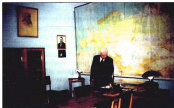
Дом культуры Звездного городка. В рабочем кабинете Юрия Алексеевича Гагарина я стоял долго, долго... Март 2001 г.