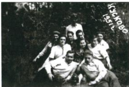
Ремесленное училище №10. Отдых учащихся и воспитателей.