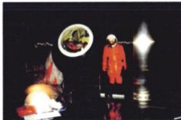
В центральном зале Мемориального музея космонавтики. Город Москва. 2001 г.

По этим предметам и по геометрии они получили пятерки».