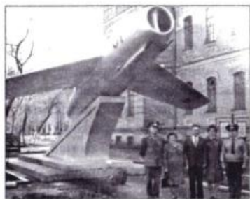
Оренбургское военно-авиационное училище летчиков. На этом самолете крепко летное мастерство Ю.А. Гагарина. В центре Тимофей Чугунов. Город Оренбург. 1975 г.