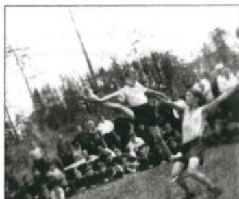
Ремесленное училище №10. На отдыхе. Фото Юрия Гагарина.

мемориальном музее Ю.А. Гагарина. Свою работу знает досконально, делает все, чтобы люди Земли больше знали о первом космонавте.