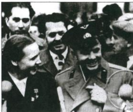
Павильон «Трудовые резервы» ВДНХ. Юрий Гагарин и В.И. Гаганова. 2-й ряд слева направо: В.И. Горинштейн, В.М. Быков. Город Москва. Сентябрь 1961 г.