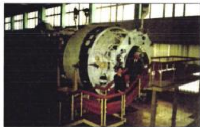
Звездный городок. У космической станции. Март 2001 г.