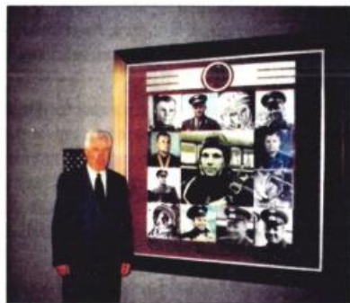
Дом культуры Звездного городка. С Юрием Гагариным вместе в год 40-летия его полета. Март 2001 г.