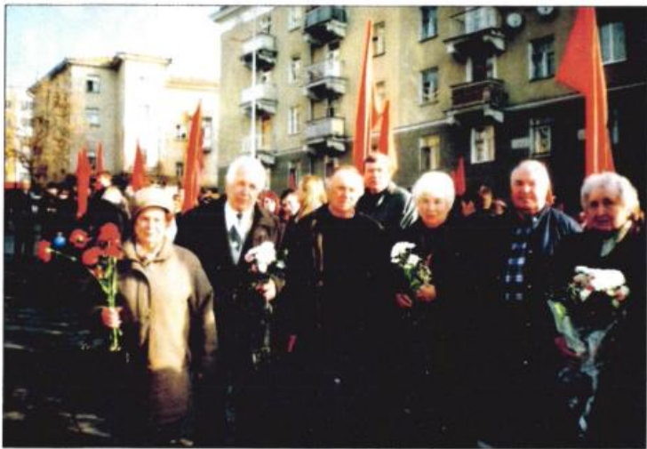
Однокашники Юрия Гагарина по Саратовскому индустриальному техникуму на митинге, посвященном 45-летию полета Юрия Алексеевича Гагарина. Город Саратов. 12 апреля 2006 г.